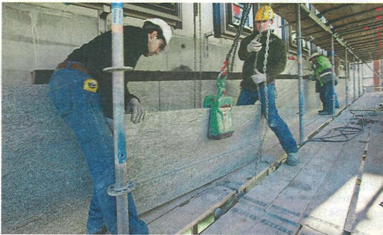
Portugese stellers monteren de platen Verde Savanna op de gevel van de plint.

De grote uitdaging bij het JuBi-project is voor de natuursteenbedrijven, die beide al hun eeuweest hebben gevierd, de logistiek. Lovend zijn ze daarom over de rust en de netheid die heersen op de krappe bouwplaats. "Je wordt hier niet opgejaagd. Aan alles merk je dat hier professionals werken. Als het in de planning allemaal snel snel moet, dan gaat dat bijna altijd ten koste van de kwaliteit."